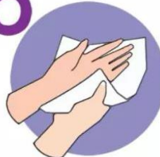
擦干双手，取适 量护手液护肤