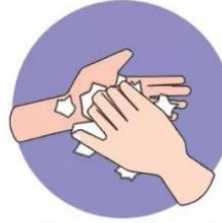
d. 弯曲手指使指关节 在另一手掌心旋转揉搓， 交换进行