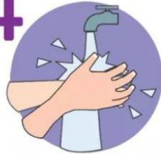
在流水下彻底 冲净双手