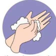
f. 将五个手指尖并拢放 在另一手掌心旋转揉搓， 交换进行