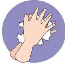
c. 掌心相对， 双手交叉指缝 互相揉搓