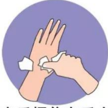
e. 右手握住左手大拇 指旋转揉搓，交换进行